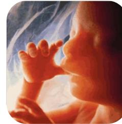
Sustancias químicas perturbadoras endocrinas