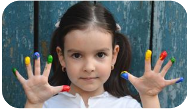
Plomo en Pintura