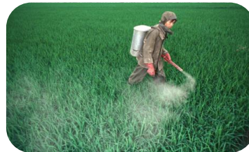
Plaguicidas altamente peligrosos