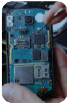
Ciclo de vida de electrónicos