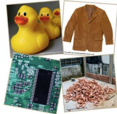
Químicos en Productos