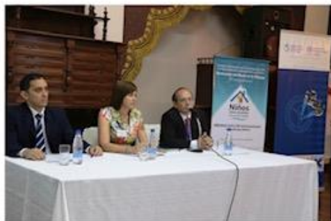
La Organización Mundial de la Salud (OMS) ha incluido al

Asunción, 14 de Noviembre de 2014 (OPS/OMS). En la oportunidad, se demostró la experiencia de otros países y la metodología de trabajo implementada en cuanto a la prevención de la exposición al plomo. El plomo es un metal pesado adherido a diferentes utensilios e instrumentos a los cuales nos exponemos diariamente.